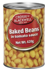
EBAL02 皇牌烘焙豆 24/420g (D.W.260g) Baked Beans in Tomato Sauce 產地：英國