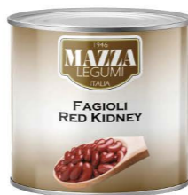
EKSY01 瑪莎紅腰子豆 6/2500g Red Kidney Bean 產地：義大利