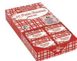
SBPB03 ❄️冷凍 迷你奶油-有鹽 10/20x10g Portion Butter 產地：法國