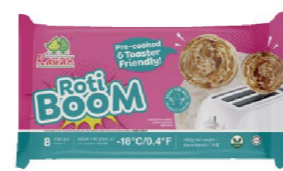
SBKA02 Kawan千層香酥餅(烙餅) 20/60g*8片 Roti Boom 產地：馬來西亞