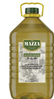
NOMA01 瑪莎橄欖粕油 4/3L Pomace Oil 產地：義大利