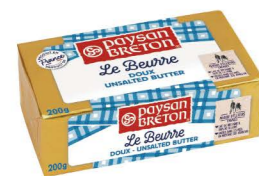
SBPB01 ❄️冷凍 奶油-無鹽 40/200g Unsalted Butter 產地：法國