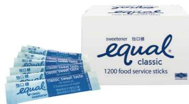
GSEQ14 Equal低糖包 1/1200x1g Sweetener Sticks 產地：泰國