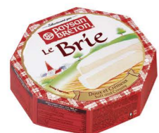
VBPB01 布利乾酪 48/125g Brie Cheese 產地：德國