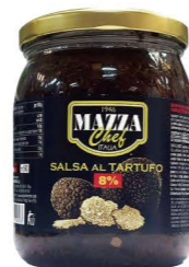
DTMA03 瑪莎夏季松露醬8% 6/500g Truffle Sauce 產地：義大利