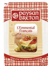
VEPB02 艾蒙塔乾酪片 14/160g Emmentaler Slices 產地：荷蘭