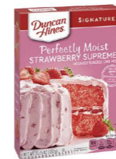
MCDH08 唐肯 草莓蛋糕粉 12/432g Signature Strawberry Supreme Cake Mix 產地：美國