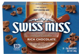
HCSM06 Swiss Miss香醇牛奶可可粉 12/10x28g Rich Chocolate 產地：美國