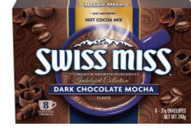
HCSM11 Swiss Miss黑摩卡風味可可粉 12/8x31g Dark Chocolate Mocha 產地：美國