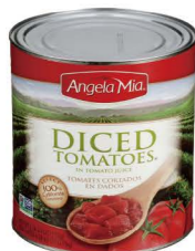
CTHU21 Angela Mia切丁蕃茄 6/2.91kg Diced Tomatoes 產地：美國