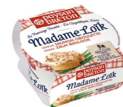
VSPB03 洛伊克夫人抹醬-鮭魚 8/150G Madame Loik Salmon 產地：法國