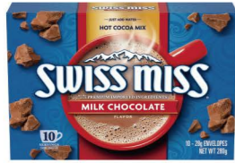
HCSM01 Swiss Miss牛奶可可粉 12/10x28g Milk Chocolate 產地：美國