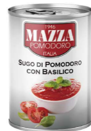
DTMA012 瑪莎經典蕃茄沙司 24/400g Classic Tomato Sauce 產地：義大利