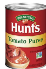
CTHU31 12/305g CTHU32 12/822g CTHU33 6/3.03kg 漢斯蕃茄泥(濕泥狀) Tomatoes Puree 產地：美國