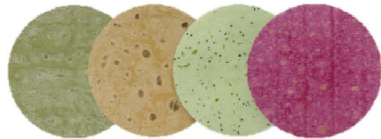
蔬菜麵粉皮 ❄️冷凍 Flavored Wraps 客訂商品