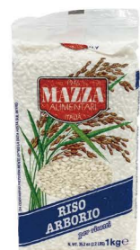
ORMA01 瑪莎Arborio義大利米 12/1kg Arborio Rice 產地：義大利