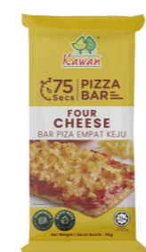
SBKA05 Kawan四重起司披薩 30/95g Four Cheese Pizza Bar 產地：馬來西亞