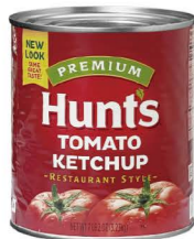
DTHU02 6/3.23kg 漢斯蕃茄醬 Tomato Ketchup 產地：美國