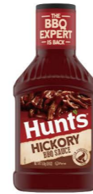
DSHU01 漢斯美式煙燻燒烤醬 12/510g Hickory BBQ Sauce 產地：美國