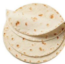
薄比薩餅 ❄️冷凍 Thin Crust Pizza Bases 客訂商品