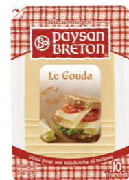
VGPB01 高達乾酪片 14/160g Gouda Slices 產地：荷蘭

Paysan Breton是一個擁有50多年歷史的法國乳製品品牌，自1969年創立以來致力於優質乳製品的生產。其產品使用簡短的成分和簡單的食譜，且99%的原料皆來自法國，為消費者帶來真實的風味。