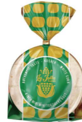
SBLA01 ❄️冷凍 La Jolla白玉米餅 6.25吋 6/10DZ White Corn Tortilla 產地：美國