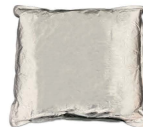
CTMA03 瑪莎袋裝碎蕃茄泥 2/5kg Fine Crushed 產地：義大利