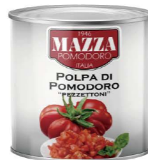
CTMA02 瑪莎蕃茄碎 6/2500g Chopped Tomatoes 產地：義大利