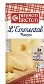
VEPB03 艾蒙塔塊 20/220g Emmenthal Block 產地：法國