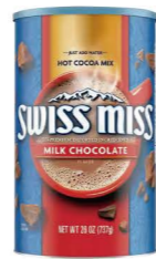
HCSM012 Swiss Miss牛奶可可粉 12/737g Milk Chocolate 產地：美國