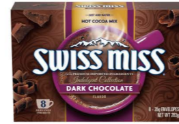
HCSM12 Swiss Miss黑巧克力風味可可粉 12/8x35g Dark Chocolate 產地：美國