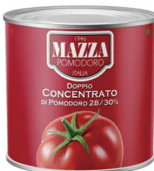
DTMA021 24/400g DTMA022 6/2.2kg 瑪莎濃縮蕃茄糊 Double Concentrate 28/30 Paste 產地：義大利