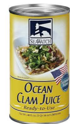
XCSE01 Seawatch蛤汁 12/1.36L Ocean Clam Juice 產地：美國