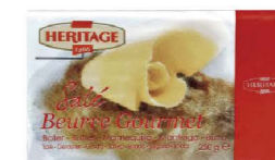
SBHE04 ❄️冷凍 有鹽奶油81% 20/250g Salted butter 81% 產地：比利時