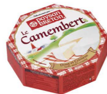
VCPB01 卡門柏乾酪 48/125g Camembert Cheese 產地：德國