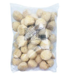
SRKA01 Kawan義大利風味起司米丸 12/1kg Cheesy Italian Rice Bites 產地：馬來西亞