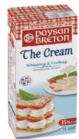
RUPB01 動物性鮮奶油35% 12/1L UHT Whip Cream 35% 產地：法國