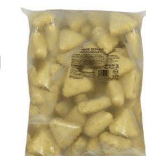
SVKA02 Kawan原味脆皮馬鈴薯塊 12/1kg Potato Croquettes Original 產地：馬來西亞