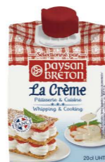
RUPB03 動物性鮮奶油30% 24/200ml UHT Whip Cream30% 產地：法國