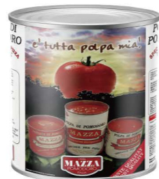
DTMA031 瑪莎蕃茄泥 6/2.5kg Tomato Puree 產地：義大利