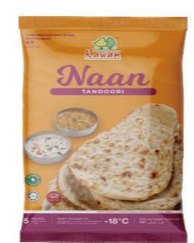
SBKA03 Kawan饅餅 24/85g*5片 Naan Tandoori 產地：馬來西亞