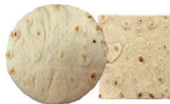
烤餅/薄餅 ❄️冷凍 Naan/Lavash 客訂商品