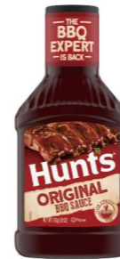
DSHU02 漢斯美式燒烤醬 12/510g Original BBQ Sauce 產地：美國