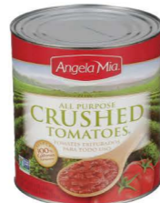
CTHU11 Angela Mia碎蕃茄 6/2.89kg Crushed Tomatoes 產地：美國