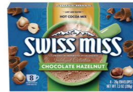
HCSM10 Swiss Miss義式榛果風味可可粉 12/8x26g Chocolate Hazelnut 產地：美國