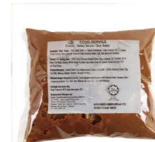
SSKA01 Kawan沙嗲醬 12/500g Satay Sauce 產地：馬來西亞