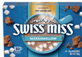
HCSM05 Swiss Miss棉花糖牛奶可可粉 12/10x28g Milk Chocolate With Marshmallow 產地：美國