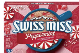
HCSM14 Swiss Miss薄荷棉花糖風味可可粉 12/6x39g Peppermint 產地：美國