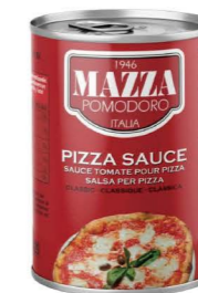
DPMA011 瑪莎經典比薩醬 24/400g Pizza Sauce Classic 產地：義大利