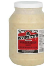
RSAT02 4/1Gal RSAT03 30/500g Atomic辣根醬 Atomic Horseradish 產地：美國