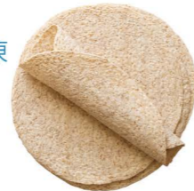
全麥麵粉皮 ❄️冷凍 Whole Wheat Wraps 客訂商品