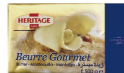
❄️冷凍 SBHE01 40/100g SBHE02 20/200g SBHE06 24/500g 無鹽奶油82% Unsalted Butter 82% 產地：比利時