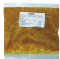
SDKA01 Kawan扁豆咖哩醬 12/500g Dhal Curry 產地：馬來西亞