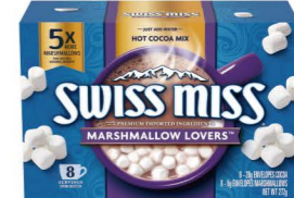
HCSM08 Swiss Miss濃情棉花糖可可粉 8/8x34g Marshmallow Lovers 產地：美國