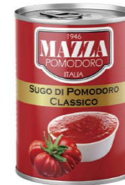
DTMA011 瑪莎義式蕃茄沙司 24/400g Tomato Sauce With Basil 產地：義大利