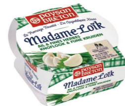
VSPB02 洛伊克夫人抹醬-大蒜 8/150G Madame Loik Garlic 產地：法國