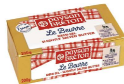
SBPB02 ❄️冷凍 奶油-有鹽 40/200g Salted Butter 產地：法國