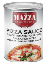
DPMA01 24/400g DPMA02 3/4.1kg 瑪莎義式比薩醬 Pizza Sauce with Spice 產地：義大利