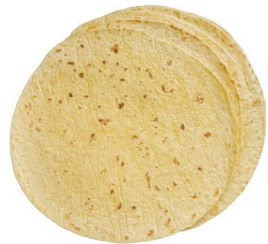
玉米餅 ❄️冷凍 Corn Tortillas 客訂商品