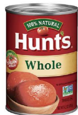
CTHU01 12/411g CTHU02 12/794g 漢斯整粒蕃茄 Whole Tomatoes 產地：美國