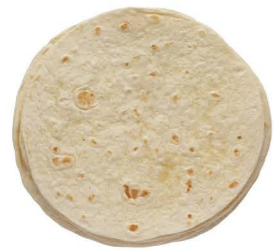
SBMI01 ❄️冷凍 6吋麵粉皮 24/12 6"Flour Tortillas 產地：馬來西亞