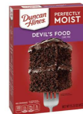
MCDH03 唐肯 魔鬼蛋糕粉 12/432g Classic Devil's Food Cake Mix 產地：美國