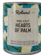
CLRO01 ROLAND棕櫚心(切片) 6/794g Heart Of Palm Precut 產地：厄瓜多