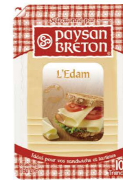
VEPB01 艾登乾酪片 14/160g Edam Slices 產地：荷蘭