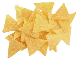
玉米脆片 ❄️冷凍 Chips 客訂商品