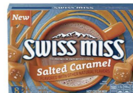
HCSM16 Swiss Miss鹹焦糖風味可可粉 12/8x39g Salted Caramel 產地：美國