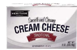
UCHE01 Heritage奶油乾酪 36/226g Cream Cheese 產地：美國