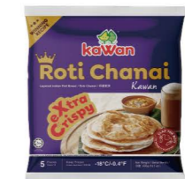
SBKA04 Kawan印度煎餅 24/80g*5片 Roti Chanai 產地：馬來西亞