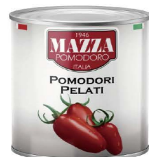
CTMA011 24/400g CTMA01 6/2500g 瑪莎蕃茄粒 Whole Peeled Tomatoes 產地：義大利