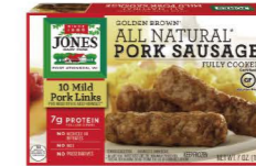
TSJO13 ❄️冷凍 Jones豬肉香腸 12/198g Pork Sausage 產地：美國