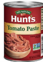
DTHU21 24/170g DTHU22 24/340g DTHU23 6/3.15kg 漢斯蕃茄配司(膏糊狀) Tomatoes Paste 產地：美國