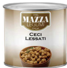
EGBH01 24/400g EGMA01 6/2500g 瑪莎雞豆(蓮子豆) Chick Peas 產地：義大利