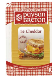
VCPB02 紅切達乾酪片 14/160g Red Cheddar Slices 產地：荷蘭