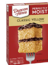
MCDH05 唐肯 經典黃蛋糕粉 12/432g Classic Yellow Cake Mix 產地：美國