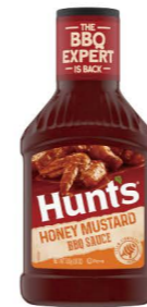
DSHU03 漢斯美式蜂蜜芥末燒烤醬 12/510g Honey Mustard BBQ Sauce 產地：美國