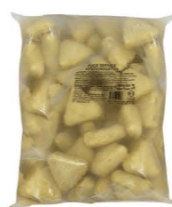
SVKA01 Kawan脆皮菠菜起司薯塊 12/1kg Spinach and Cheese Potato Croquettes 產地：馬來西亞