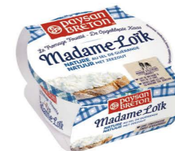
VSPB01 洛伊克夫人抹醬-原味 8/150G Madame Loik Plain 產地：法國